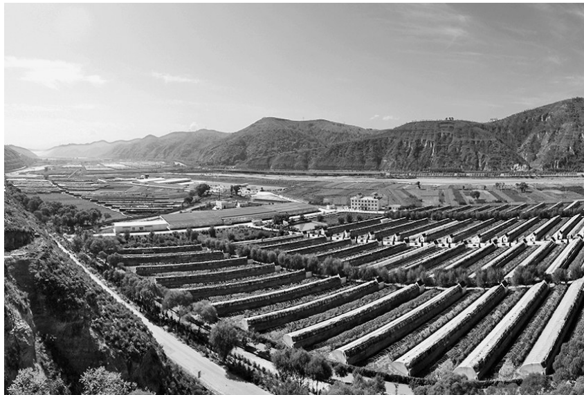
李家湾村蔬菜大棚示范园