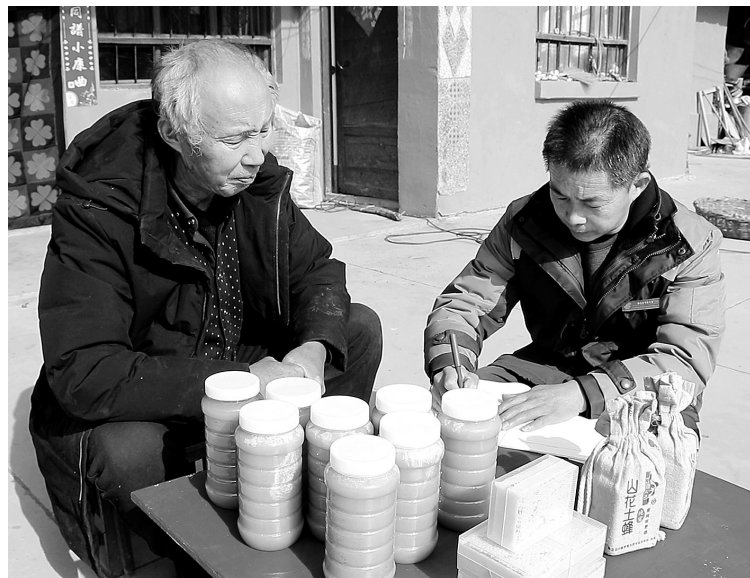
● 快递员上门收取群众快递

农村群众居住分散、路程远、路况复杂等问题限制了快递服务的发展，也让“最后一公里”成了农村快递投递难题。近年来，黄龙县着力解决农村快递投递问题，让快递包裹入村入户，带给群众满满的幸福感。