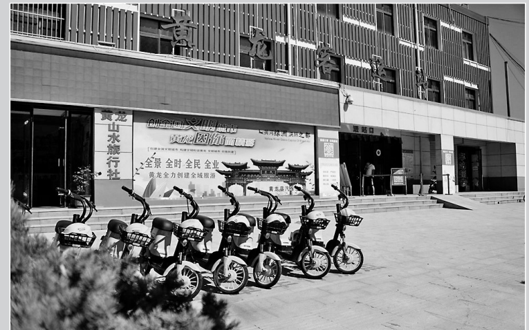
● 黄龙干净整洁的街道