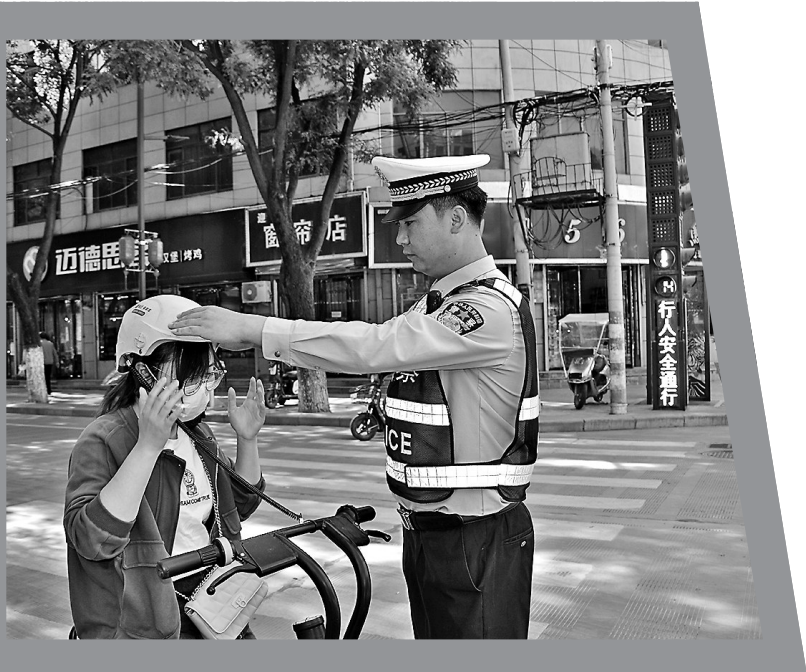
● 交警提醒市民正确佩戴头盔

近年来，黄龙县坚持以人民为中心，聚焦群众所需所盼，在社会治理中，走出了一条符合黄龙实际的新路子。如今，黄龙的社会治理水平迈上新台阶，人民群众的安全感、幸福感不断增强。