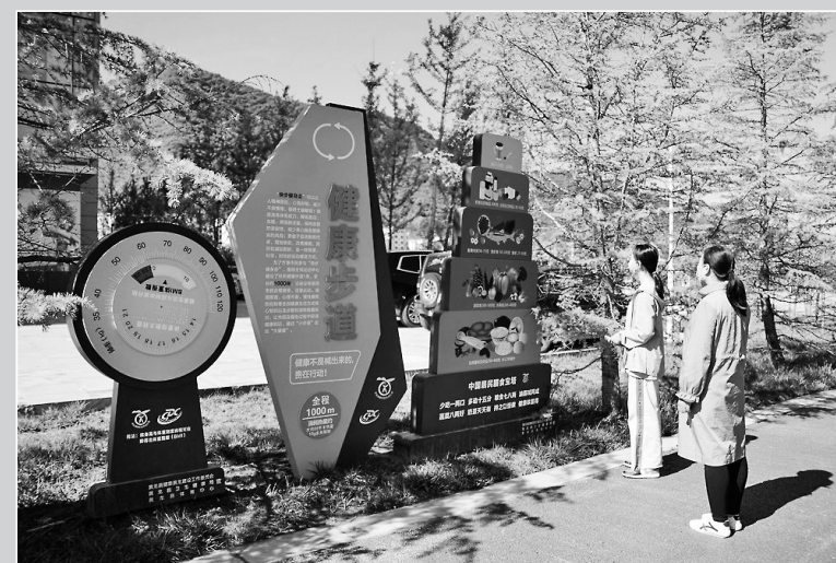
● 市民驻足观看文明城市创建内容