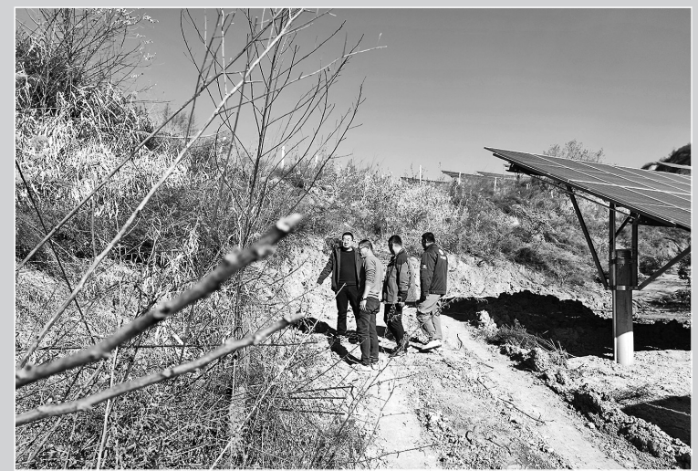
● 三岔司法所开展司法调解工作