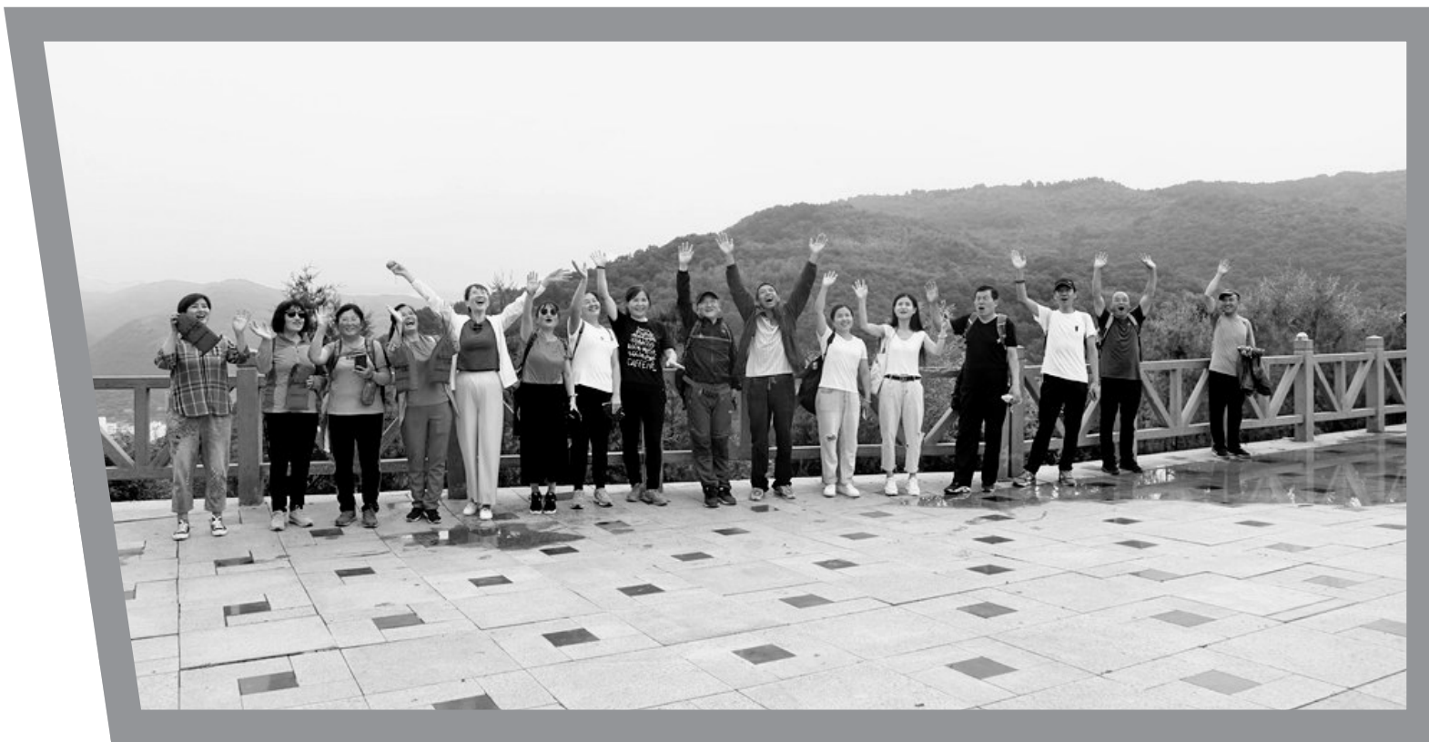
● 文明和谐的黄龙小城吸引了五湖四海的游客