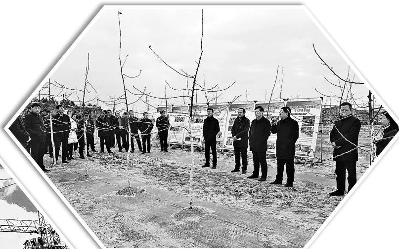
● 志丹县召开春季农业生产果园管理现场会