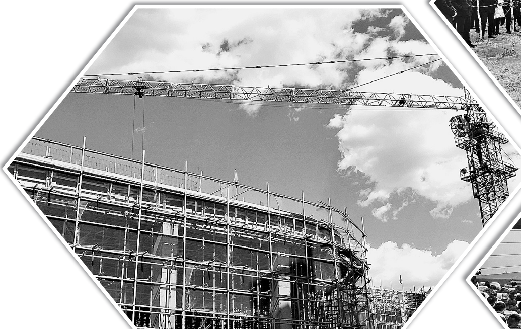
▲ 建设中的志丹县第四幼儿园