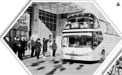
▲ 20名志丹学子赴西安高新一中初中部交流学习