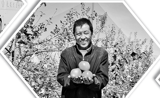
▼ 苹果产业让志丹县老百姓的日子越过越红火