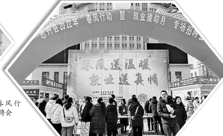
▶ 志丹县举行2022年“春风行动”暨“就业援助月”专场招聘会