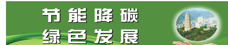
节能降碳 绿色发展

念馆和“陕北三战三捷”纪念馆陈列布展按期完成并对外开放,受到社会各界一致好评。 在中国革命博物馆馆城建设中,我市按照老城区多拆少建、革命旧址周边只拆不建的思路,相继完成延安宝塔、鲁艺等旧址周边环境改造提升工程及抗大、陕甘宁边区政府交际处等旧址周边拆迁工作,共征收建筑面积263.6万平方米,为革命文物保护利用