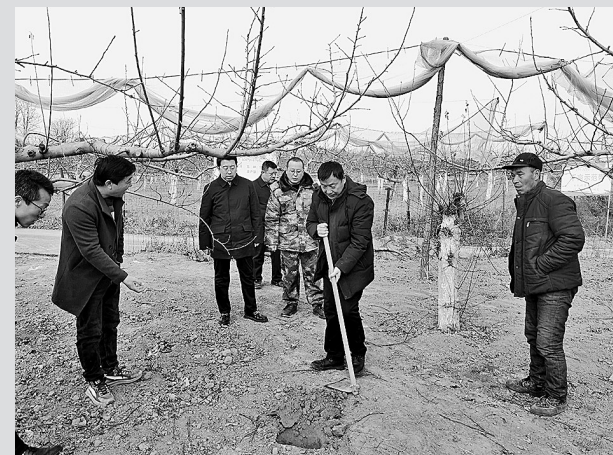
● 果业专家为果农讲解春管技术要领