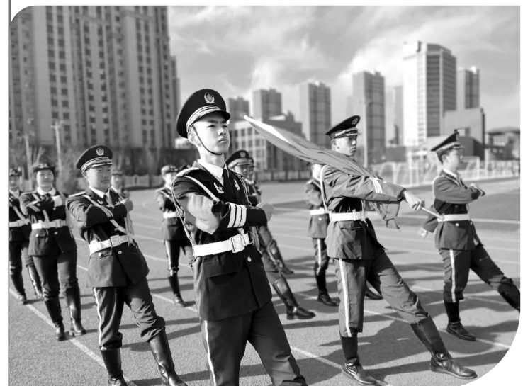
● 开学典礼的升旗仪式

天高云淡气微爽,万象伊始迎新高。3月2日上午,延安市新区江苏中学举行2022年春季开学典礼,伴随着雄壮的国歌声,五星红旗冉冉升起。