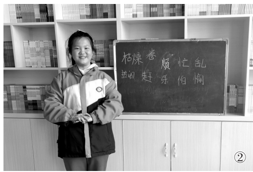
① 老师引领 ② 积极分享 ③ 踊跃参与