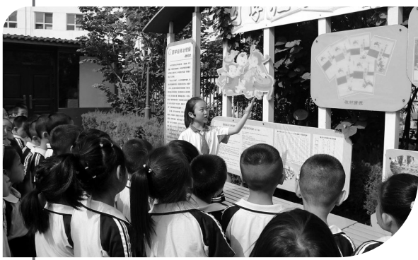
● 校园里的小小讲解员