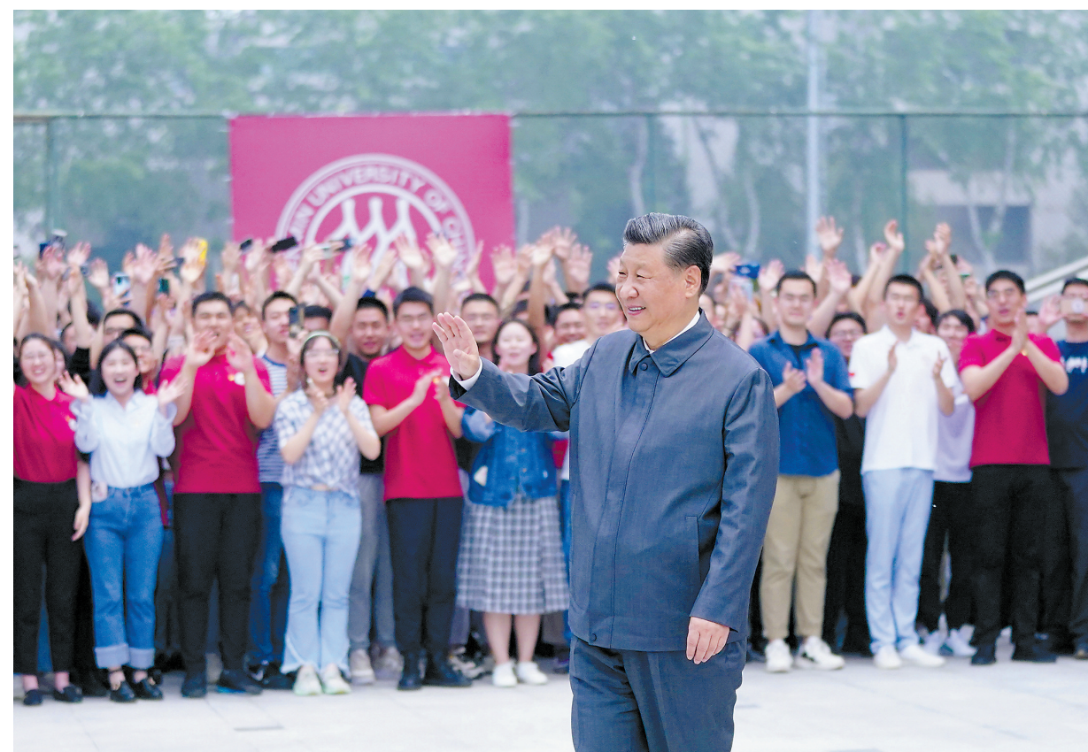
4月25日上午,中共中央总书记、国家主席、中央军委主席习近平来到中国人民大学考察调研。这是习近平向师生们挥手致意。

新华社北京4月25日电 在五四青年节即将到来之际,中共中央总书记、国家主席、中央军委主席习近平25日上午来到中国人民大学考察调研。习近平代表党中央,向全国各族青年致以节日的祝贺,向中国人民大学全体师生员工、向全国广大教育工作者和青年工作者致以诚挚的问候。习近平希望全国广大青年牢记党的教诲,立志民族复兴,不负韶华,不负时代,不负人民,在青春的赛道上奋力奔跑,争取跑出当代青年的最好成绩! 习近平强调,“为谁培养人、培养什么人、怎样培养人”始终是教育的根本问题。要坚持党的领导,坚持马克思主义指导地位,坚持为党和人民事业服务,落实立德树人根本任务,传承红色基因,扎根中国大地办大学,走出一条建设中国特色、世界一流大学的新路。广大青年要做社会主义核心价值