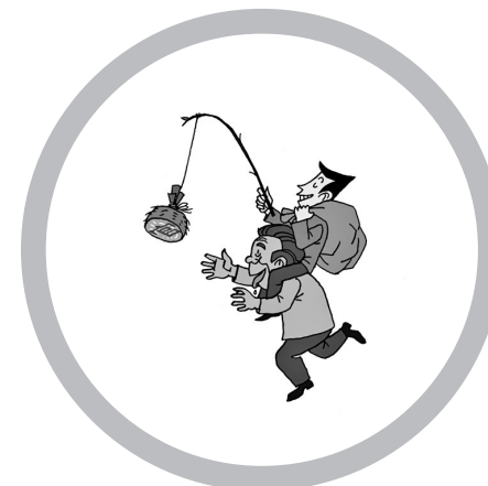
● 驾！再给我取点钱去！傅晓宁 作

江西省纪委监委组织部相关负责人提醒，党员干部千万不能权迷双眼，企图靠关系走捷径，那样只会掉进陷阱之中。