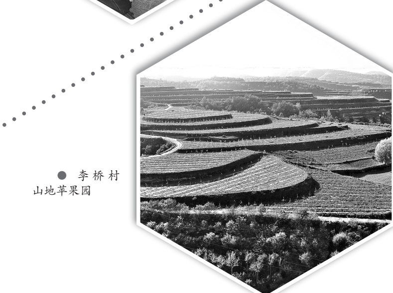
● 李桥村山地苹果园