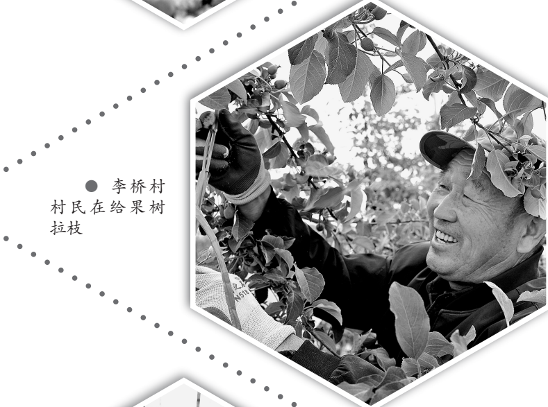
● 李桥村村民在给果树拉枝