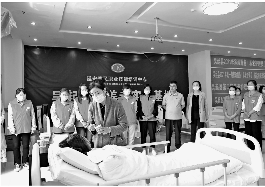
● 吴起县劳动就业服务中心开办养老护理培训班

训结业后,被延安惠民职业技能培训中心聘为职工。她说:“我对养老护理工作很感兴趣,现在月收入3000多块钱。在工作的同时我还在不断学习,力争通过考试取得高级养老护理员资质。” 据了解,2021年以来,吴起县劳动就业服务中心通过与延安惠民职业技能培训中心合作,开办养老护理培训班4期,培训合格学员560余人,上岗195人。有的学员培训结业后虽然不想找工作,但在家庭中成为了护理老人的主力。吴起县瞄准市场,通过切实有效的养老护理培训,为吴起老年康养打造了一支有情怀,有热情,有奉献的专业养老护理队伍。 就业是民生之本,技能培训是就业之源。为了鼓励更多劳动者参加就业创业技能培训,吴起县在学员培训全程免费的基础上,还制定了五条激励就业创业措施:一是不定期举办学员就业招聘会,促进学员与企业签约就业;二是对创办个体经营的学员,优先办理创业担保贷款,最高金额为20万元;三是对创办企业的学员,通过申请可优先办理最高300万元的创业担保贷款;四是为创办经营实体的学员发放5000元一次性创业补贴;五是对技能大赛获奖学员通过媒体广泛宣传,提高知名度。 近年来,吴起县在就业创业培训工作中,始终坚持“以培训带动创业,以创业促进