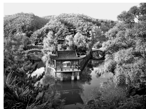
● 山清水秀的王湾村