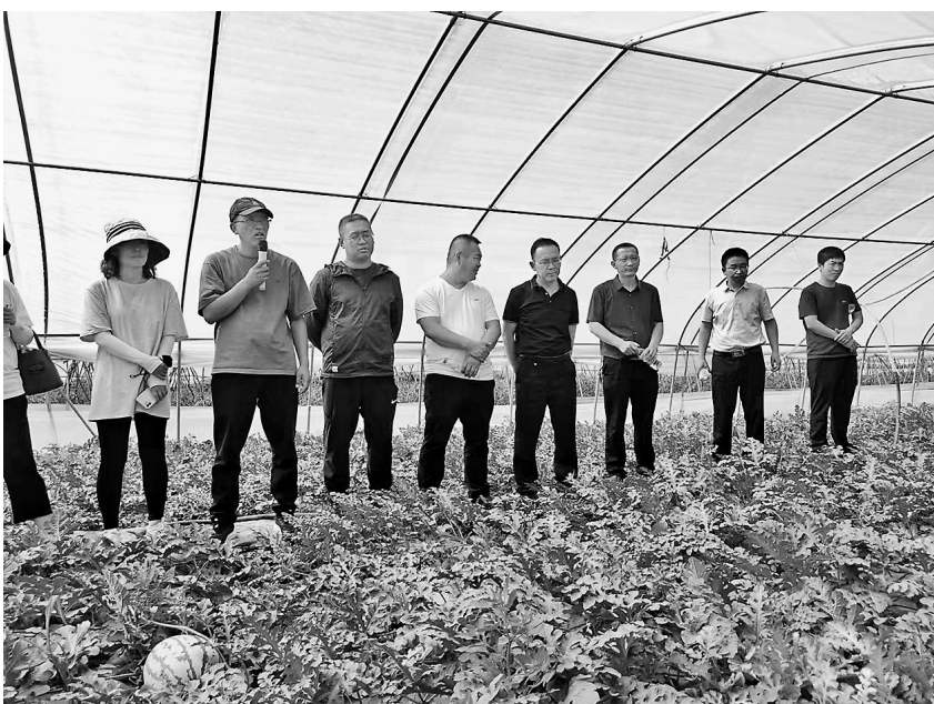
● 农技专家与农民一起交流学习

本报讯（记者 王静 通讯员 杨晓霞）眼下，正是大棚蔬菜瓜果成熟的关键时期，也是种植户最需要技术指导的时候。近日，宝塔区蔬菜技术推广与营销服务中心的农技专家们深入田间地头，手把手指导农民科学种植，助力农民有个好收成。