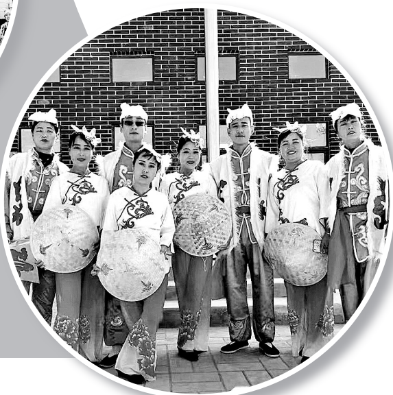
● 京兆村七夕文艺汇演