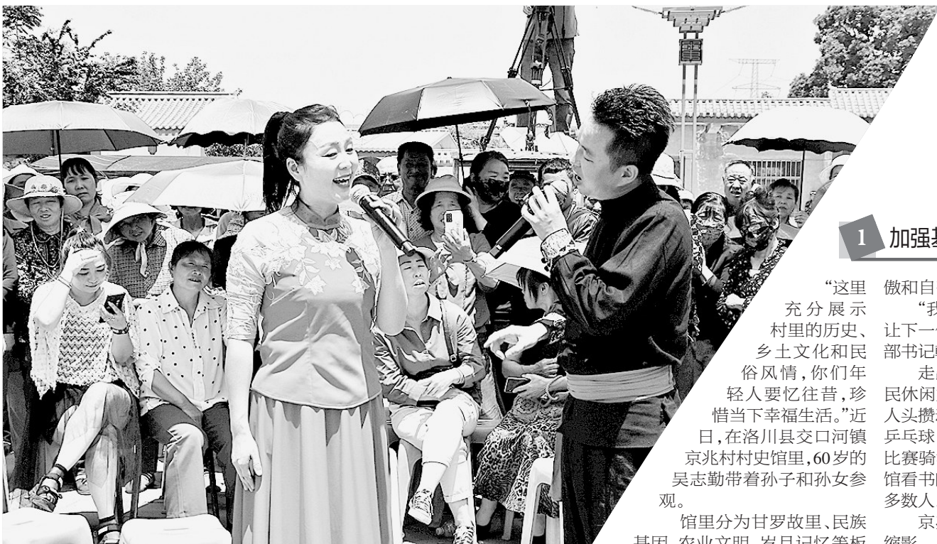
● 阿寺村文化惠民演出

洛川素有中国民间艺术之乡的美称。洛川因洛河穿境而得名，潺潺不息的洛河水滋养了勤劳朴实的洛川人民，时光堆积的黄土地孕育了皮影、剪纸等厚重的历史文化。