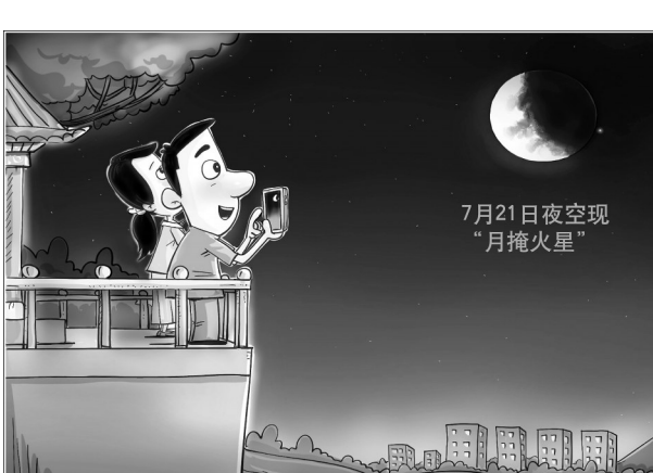
7月21日夜空现“月掩火星”

修立鹏表示,对于我国其他地区的观测者,月球和火星午夜过后才升上地平线,虽然无法看到掩星的过程,但微微泛红的火星与明亮的月亮近距离争辉的场面也很有看点。