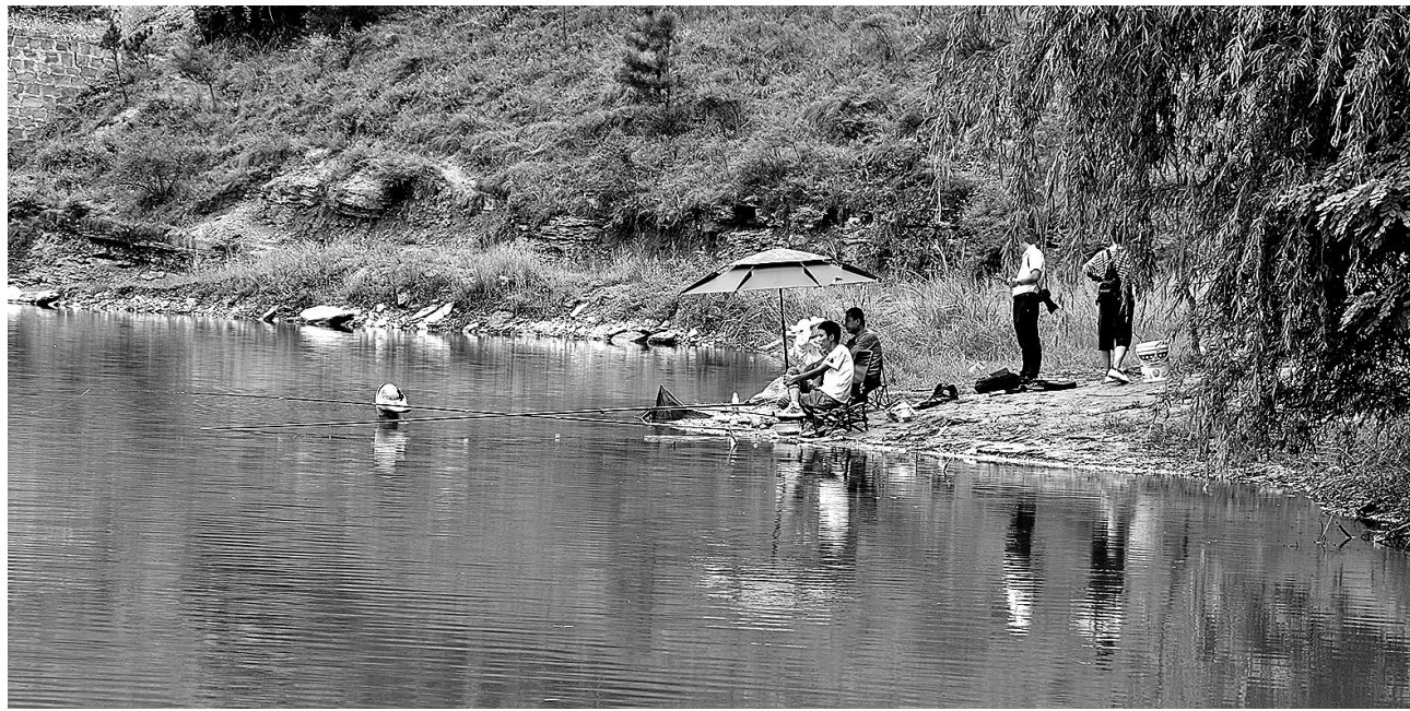
● 游客在池塘边休闲垂钓

白天,在田野里尽情游玩采风、闲坐钓鱼,静享天然氧吧,感受垂钓乐趣;傍晚,伴着拂面微风,闻着花香四溢,烹茶煮酒,畅谈美好未来,憧憬幸福生活。初秋,一幅诗情画意的休闲旅游景象正在延川县徐徐展开。