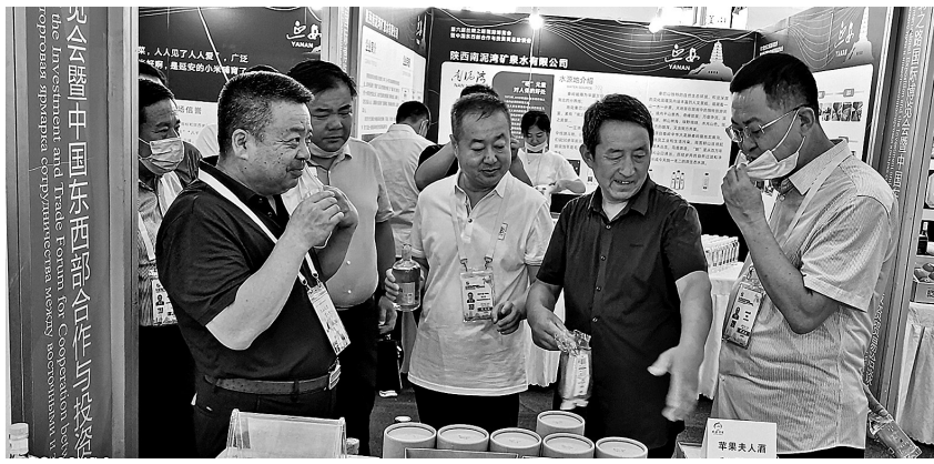
● 博览会上,宜川苹果酒深受客商青睐

俗话说“酒香不怕巷子深”。在宜川县秋林镇大子村就有一家胡家酒坊,它因酿造苹果酒而远近闻名,香甜浓郁的苹果酒香不仅陶醉了顾客,也让果农们尝到了种苹果的“甜头”。