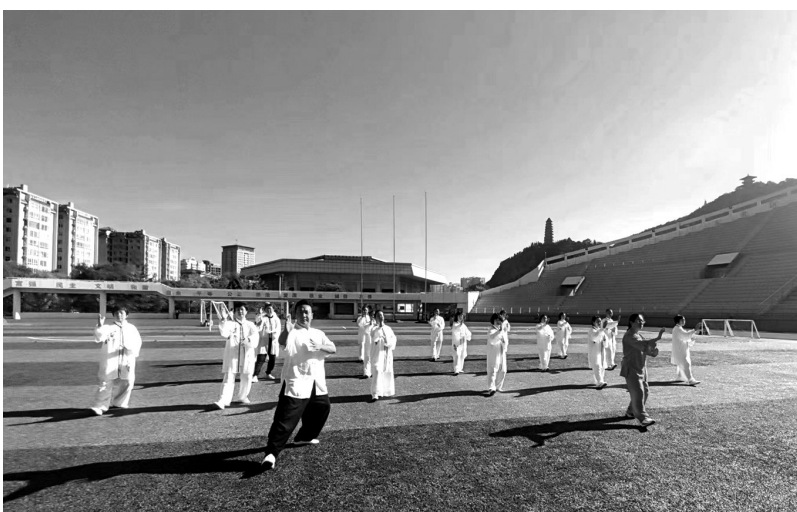
● 群众在延安体育场进行太极拳健身运动

积极发挥各级领导机构作用。进一步强化党对全民健身工作的领导,发挥各级人民政府全民健身工作议事协调机构作用,加强对制约全民健身工作的重难点问题研究,督促县(市、区)、市级有关部门贯彻会议的决策部署和全民健身工作有关政策的推动落实,开展评估和报告工作。各级全民健身工作议事协调机构的成员单位,要落实国家关于全民健身的政策措施,在职责范围内全力保障全民健身事业发展。对在全民健身工作中作出突出贡献的组织和个人,按照有关规定给予表彰、奖励,形成政府主导、部门协同、全社会共同参与的全民健身良好工作局面。