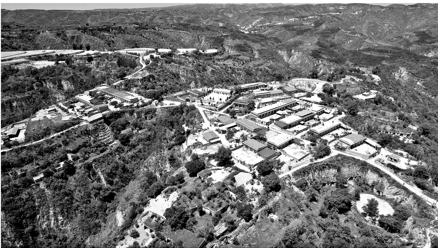
● 航拍益枝新村全景

益枝村出人才。最有名的是出了陕西省原第二书记李瑞山,有口皆碑。我在整理延长县红色党史资料时,又发现益枝李家的两位教育名人——受到毛泽东主席三次接见的李国芬,“教育救国”的李立楷。为得到更多资料,我找到了李立楷的儿子李卉,一位满头银发梳得一丝不苟、面色红润的儒雅老人,已八十多岁了,神采奕奕,也是大半生从事教育工作。他热情地为我讲述了家族往事,还赠我两本书,一本是他写的回忆父亲生平的《儿女心中不落星》,一本是散文集《钝笔游走集》。随着不断地探寻,益枝村越勾起我浓厚的兴趣。