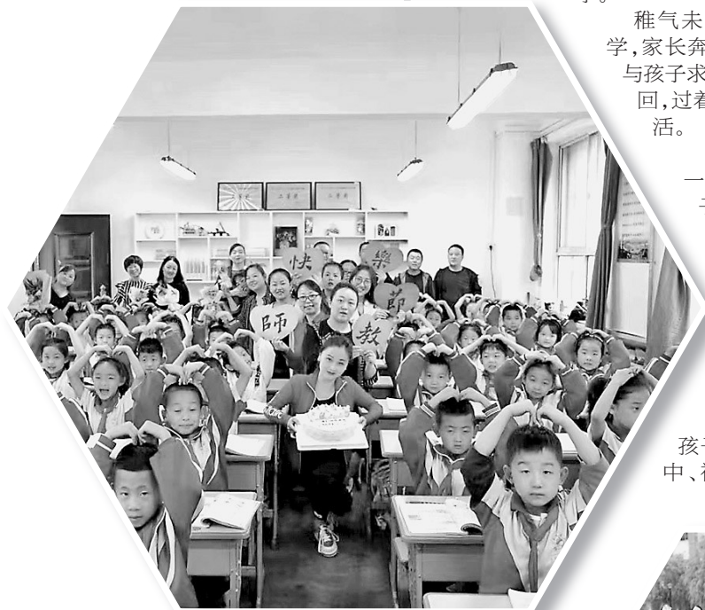
● 孩子们为老师送上教师节祝福

从“有学上”到“上好学”，从“全面普及”到“优质均衡”，从“一个都不能少”到“家门口的‘好学校’”，不管是过去的辉煌成绩，还是未来的突破发展，富县，始终把教育作为最大的民生，教育事业也在驶入持续稳定、健康发展的轨道，一幅教育现代化新征程的画卷正在徐徐展开。