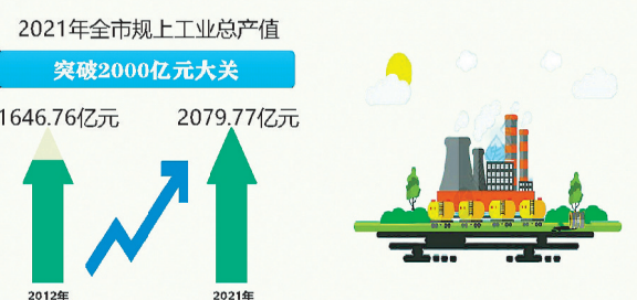
2021年全市规模以上工业总产值突破2000亿元大关