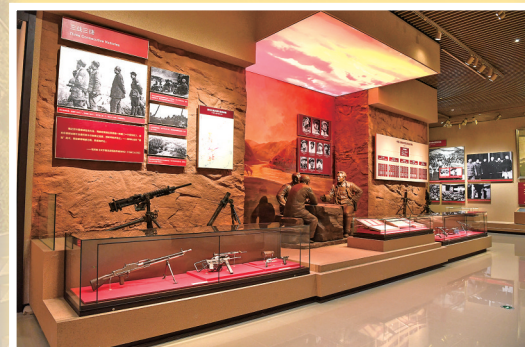
● 延安革命纪念馆馆内陈列