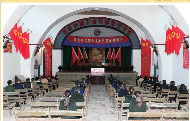
● 全市文博系统职工代表在杨家岭“七大”旧址收看党的二十大开幕会直播