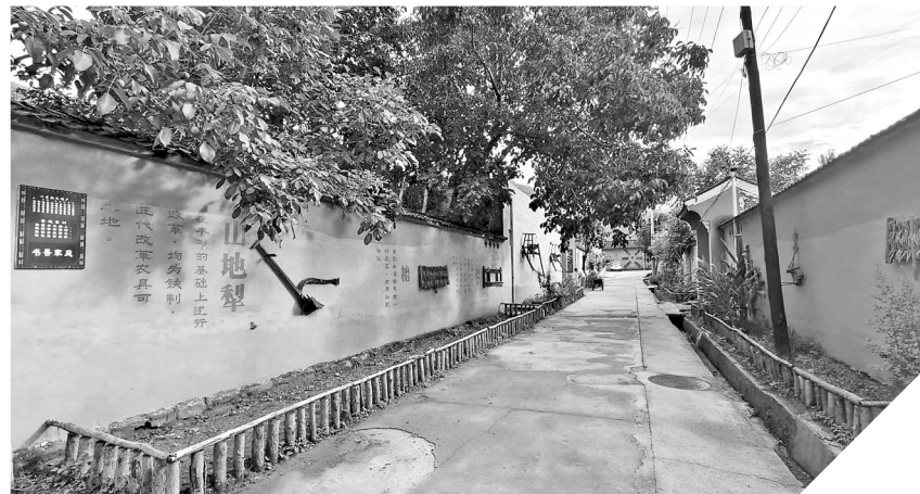
● “印象圪崂”农耕文化主题巷道一角