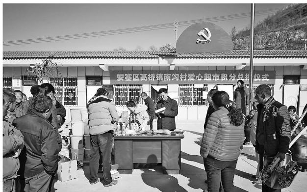
● 高桥镇南沟村“爱心超市”积分兑换活动现场

走进安塞区沿河湾镇茶坊村“爱心超市”，可以看到花生油、牙膏、洗衣液、沐浴露、纸巾等各类生活用品整齐摆放在货架上，每种物品都“明码标价”，墙上张贴着兑换标准和兑换流程，前来“购物”的村民正在货架上挑选着自己需要的物品。