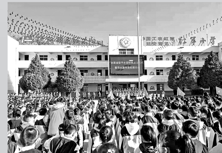
● 黄龙县中心小学开展节水型校园创建活动