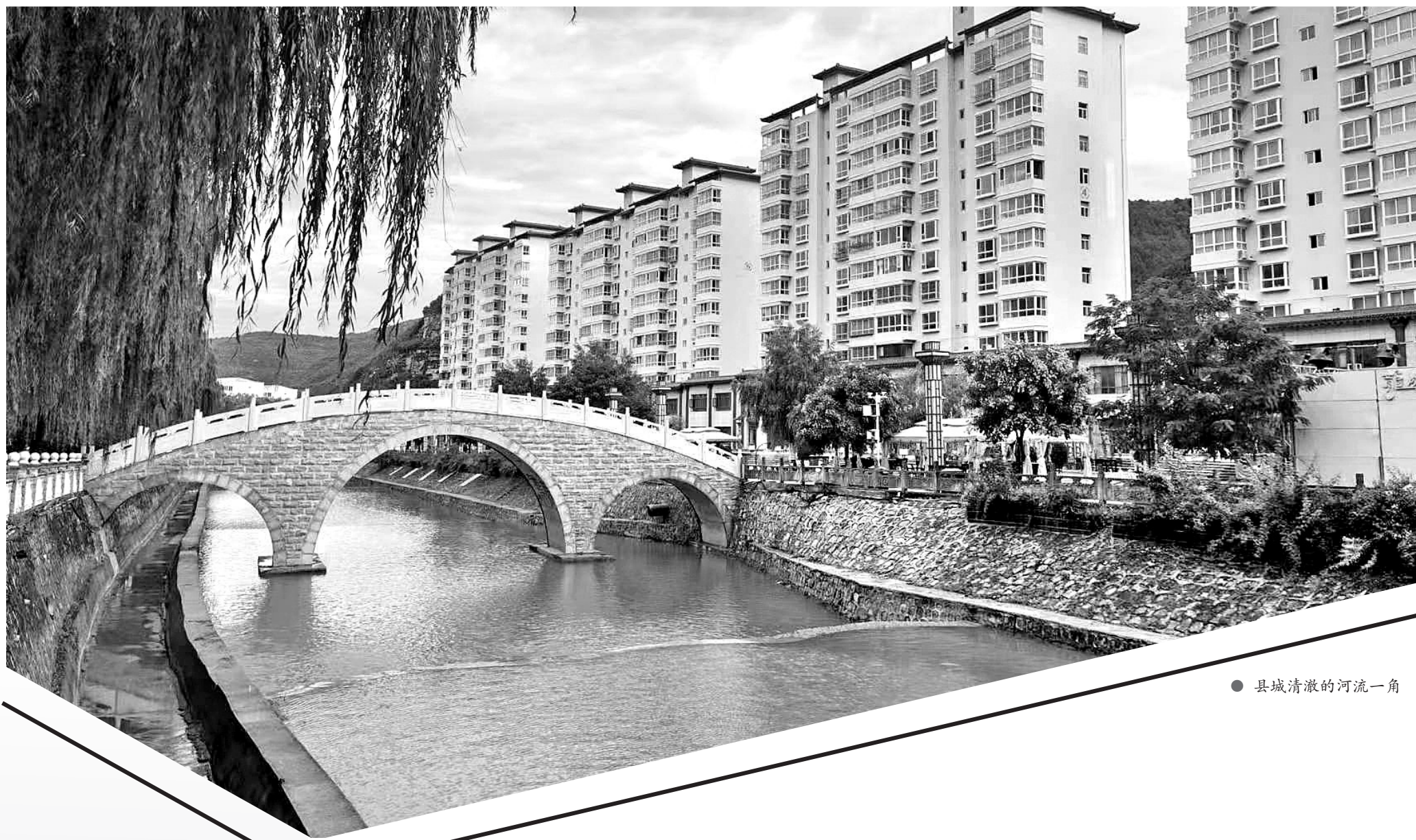
● 县城清澈的河流一角

一滴水，浸花草，五彩缤纷映芬芳；一汪水，润农田，硕果累累粮丰收；一池水，滋万物，鱼蟹肥壮农副旺。水，乃生命之源，珍贵不可替代。