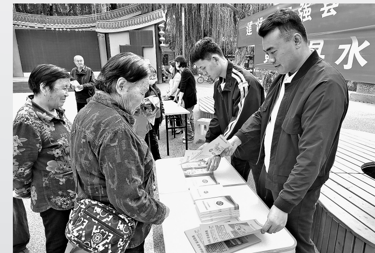
● 县水务局在城西广场开展节水宣传活动

滴滴清水，用之不觉，失之难存。近年来，黄龙县深入贯彻“节水优先、空间均衡、系统治理、两手发力”的治水方针，把节水型社会建设作为推动县域经济社会健康持续发展的重要战略任务，坚持政府引导、部门协同、社会合力、多措并举的思路，把“节水优先”贯穿经济社会发展和水生态文明建设全过程，顺利完成节水型社会达标创建，水资源管理制度考核连年获得优秀县区。