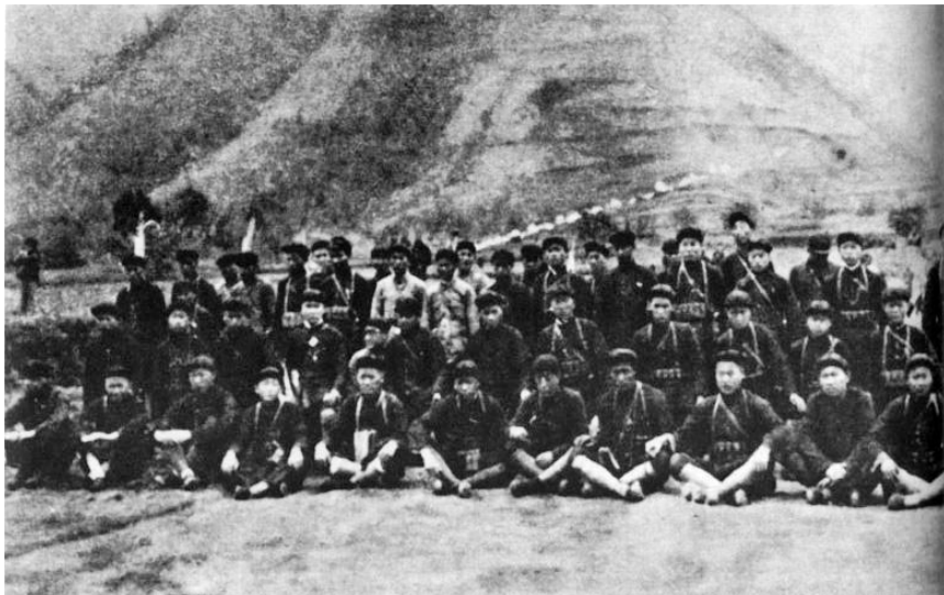
● 参加直罗镇战役的红十五军团手枪连

11月21日拂晓，直罗镇战役打响，至11月24日，红军围歼东北军第一〇九师，又在张家湾地区歼灭援敌一〇六师一个团，总计俘虏敌人5300