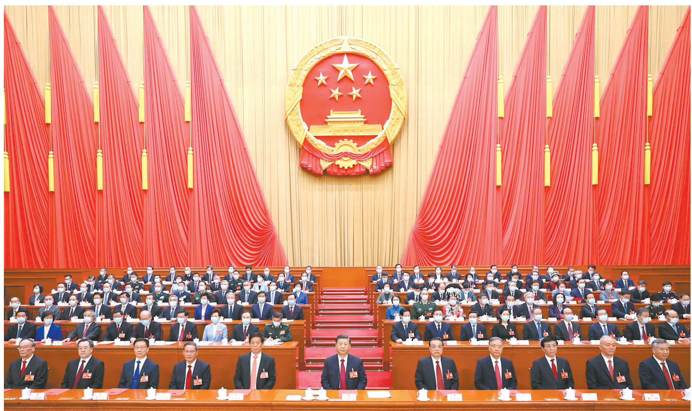
3月13日,第十四届全国人民代表大会第一次会议在北京人民大会堂闭幕。中共中央总书记、国家主席、中央军委主席习近平发表重要讲话。