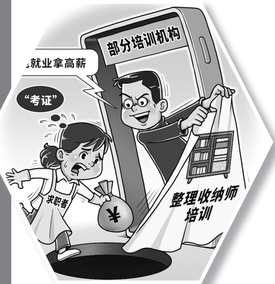
● 培训陷阱 程硕 作

“学完立马月上万元”“颁发国家认可的职业资格证书”“有证即可包分配”……“新华视点”记者调查发现，当前，部分培训机构打着整理收纳行业“有证才能上岗”的幌子，以“就业包分配”“轻松拿高薪”为诱饵，制造培训陷阱，引发大量投诉纠纷。