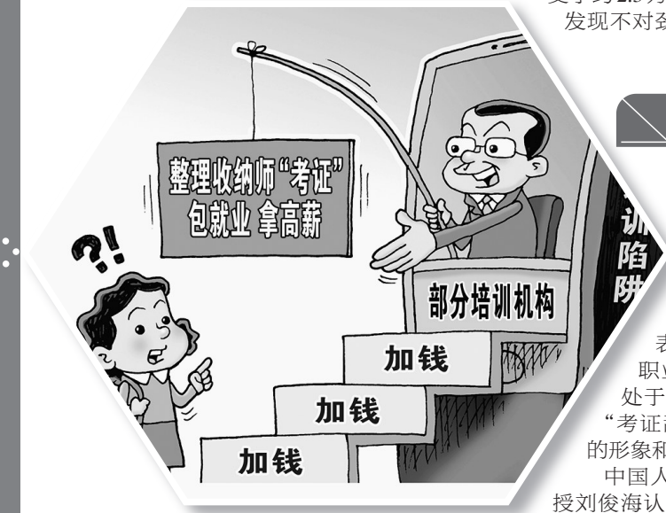
● “步步加钱” 新华社发 徐骏 作