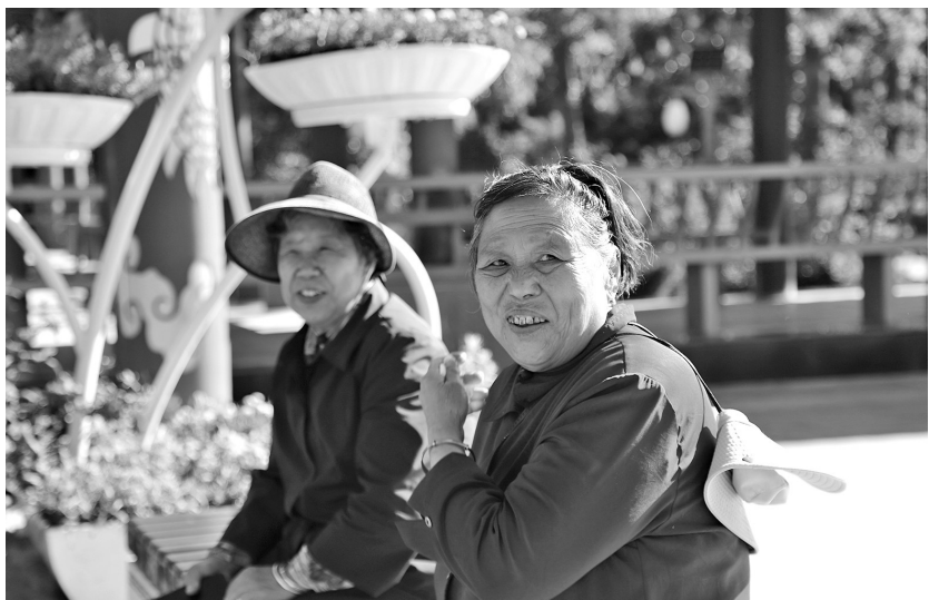
● 迎客松公园里群众休闲放松

“公园+地摊”“公园+市场”等空间功能组合，不断为市民提供便利，加出市民的“幸福空间”。因地制宜推进立体绿化、拆墙透绿等工作，不断完善城市绿地系统，实现土地资源的精细化利用，激发社区文化活力，为市民打造更加舒适的生活环境，进一步增强城市“绿肺”功能，提升居民的获得感和幸福感，实现市民“五分钟休闲圈”的生态宜居梦想。