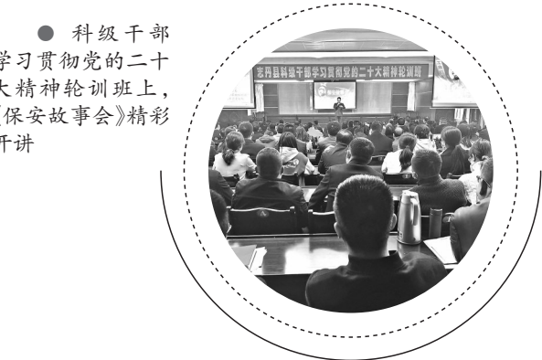
● 科级干部学习贯彻党的二十大精神轮训班上《保安故事会》精彩开讲