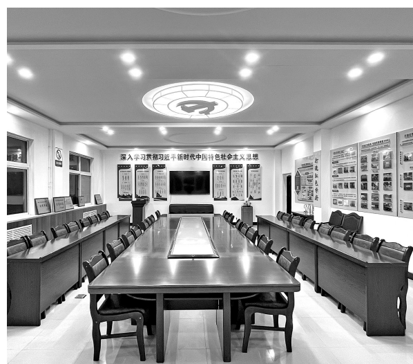
● 宽敞整洁的志丹县委党校多媒体教室