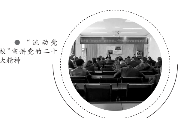
● “流动党校”宣讲党的二十大精神