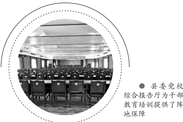
● 县委党校综合报告厅为干部教育培训提供了阵地保障