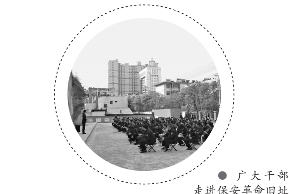
● 广大干部走进保安革命旧址开展培训活动

据统计,仅2022年,该县在落实疫情防控要求的同时,先后举办领导干部学习贯彻党的十九届六中全会精神、党的二十大精神、新入职公务员、年轻干部、党务工作者、党员发展对象等主体培训15期1636人次。开展党日活动50余场次,参与党员达5800余人。