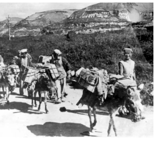
陕甘宁边区群众为部队运送弹药