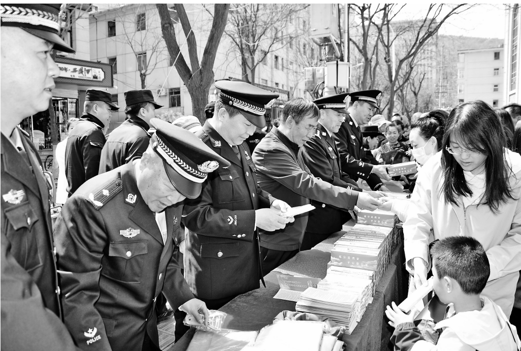
● 宣传教育活动现场

据悉,此次宣传活动通过展示反恐最小作战单元反恐演练,利用广场LED电子屏滚动播放反恐、识恐动漫视频,摆放反恐知识展板,发放反恐宣传资料、手册等多种方式,有效普及了恐怖袭击事件预防、处置、自救、互救等知识,切实增强了全民反恐意识,为推动形成全民反恐的良好氛围打下了坚实基础。市公安局反恐、国保、网安支队和宝塔区反恐办、宝塔公安分局及宝塔区相关企业代表共计100余人参加了此次宣传教育活动。