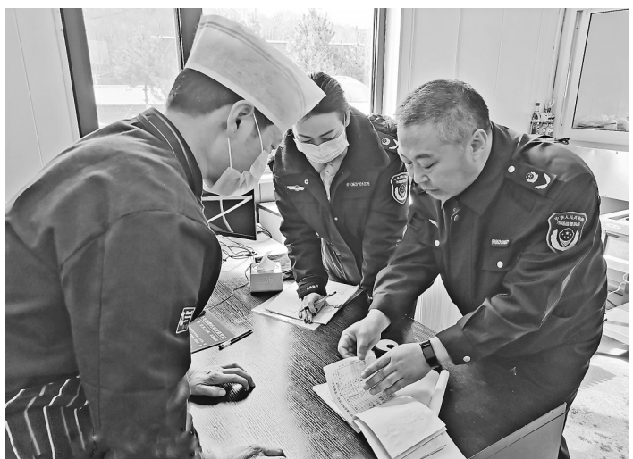
县市场监管局工作人员进行现场执法

本报讯(通讯员 白杨越)“太感谢你们了，在你们的支持和指导下，不仅帮助我们规避了使用超期未检计量器具的违法风险，还排除了食品安全隐患，保障了我们小寺庄煤矿健康发展。”黄龙县小寺庄煤矿负责人激动地说。