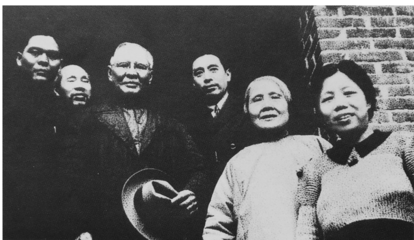
● 1941年冬,周恩来、董必武、邓颖超接见美国华侨领袖司徒美堂(左三)、黄兴夫人徐宗汉(右二)时的合影