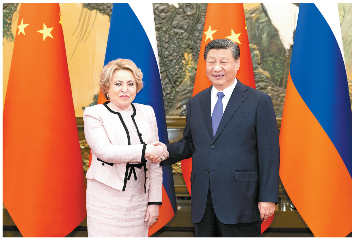
● 7月10日下午,国家主席习近平在北京人民大会堂会见俄罗斯联邦委员会主席马特维延科。

新华社北京7月10日电(记者 郑明达)国家主席习近平7月10日下午在人民大会堂会见俄罗斯联邦委员会主席马特维延科。 习近平指出,在双方共同努力下,中俄关系始终保持健康稳定发展势头,各领域合作稳步推进,两国世代友好的社会基础和民意基础更加牢固。今年3月,我对俄罗斯进行国事访问,同普京总统就深化两国全面战略协作和各领域务实合作达成新的重要共识。发展中俄关系是两国基于各自国家和人民根本利益作出的战略选择。中方愿继续同俄方一道,发展守望相助、深度融合、开拓创新、普惠共赢的新时代全面战略协作伙伴关系,助力两国发展振兴,推动建设繁荣稳定、公平公正的世界。 习近平强调,立法机构合作是中俄关系的重要组成部分。希望双方共同努力,落实好我同普京总统达成的重要共识,从立法层面促进和保障两国各领域合作持续健康发展,加强立法及治国理政经验交流,推动两国立法机构合作再上新台阶。双方还要加强在上海合作组织、金砖国家等多边机制内的沟通协作,引领全球治理改革正确方向,维护好新兴市场国家和发展中国家共同利益。 马特维延科表示,俄中全面战略协作伙伴关系符合两国利益和两国人民意愿,已达到历史最高水平并继续稳步发展。习近平主席今年3月对俄进行的成功国事访问为俄中关系进一步发展注入强劲动力。俄议会广泛支持深化俄中合作,愿同中国全国人大进一步加强交流对话,为落实两国元首共识提供法律保障。 王毅、王东明参加会见。