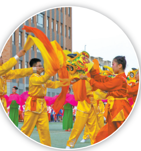
● 彩绸飞舞、生机蓬勃的秧歌展演现场

“人”字是孩子们入学后学写的第一个字，也是学习做人的开端。人生聪明识字始，一撇一捺写成人，一生一世学做人，一个“人”字在孩子们小手中跃然呈现，希望孩子们能像“人”字一样，堂堂正正、顶天立地。（记者 贺卓）