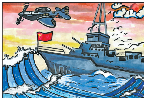
宝塔区第七中学初二(11)班