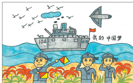
延安市特殊教育学校六年级