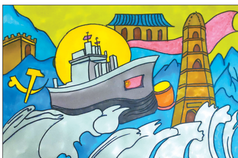
新区第二小学一年级(14)班