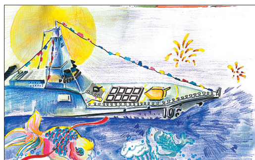
新区第二小学三年级(4)班