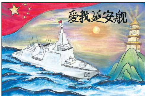
宝塔区第七中学初一(3)班