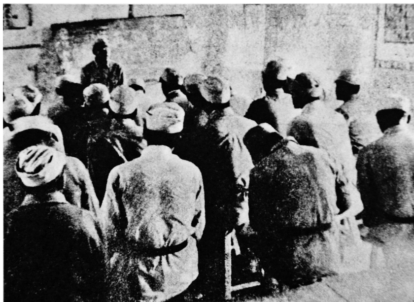
● 日本工农学校在上课

1941—1942年,在华北、华中抗日根据地建立了晋察冀、山东(后改称滨海)、冀中、淮北、苏北等5个支部。盟员