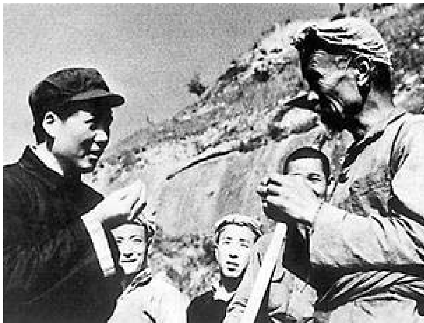
● 毛泽东与农民交谈

陕甘宁边区政府直属县市长联席会议，于1941年5月31日至6月5日在延安举行。开幕当日，林伯渠主席报告施政纲领意义。6月1日，林伯渠对调节运盐办法作了重要指示，与会同志均非常兴奋，并热烈地进行讨论。6月2日，各县县长作生产自给及经济建设工作报告。6月3日上午，财政经济处长曹力如结合各县长报告，提出三点结论：(一)就各县第一季度成绩看来，1941年度各县生产总成绩，平均数目可以做到完全自给，为边区生产自给工作上一大跃进与财政上一大保证；(二)各县生产自给必须以农业为基本，尽量发展纺织及运输业，商业收入最多不得超过全部生产量的30%。(三)个别县在生产自给中所犯的严重错