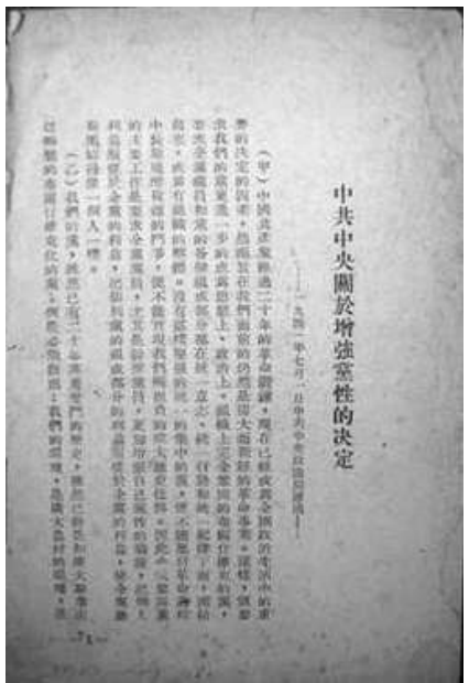
中共中央关于增强党性的决定

中国共产党经过20年的革命斗争锻炼,1941年时已经成为拥有80万党员的全国性大党,它有着50万八路军、新四军和10余个抗日民主根据地,领导着敌后一千万以上的同胞,为争取民族独立、领土完整和民主自由而不懈努力。党的发