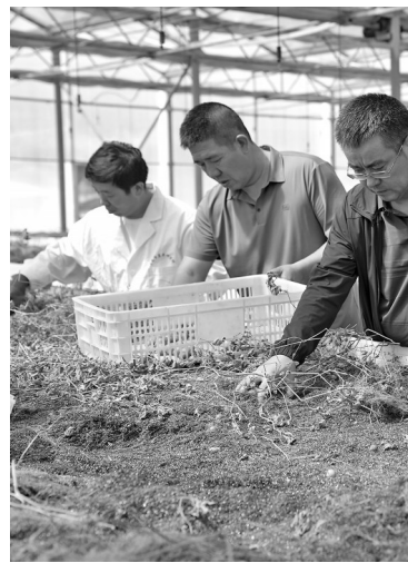
● 工作人员采收马铃薯“原原种”

本报讯(记者 谷端瑜 通讯员 张亚宁)“这种薯圆润饱满,比起去年培育的情况好了很多。”“是啊,还要在温度上继续把控。”近日,子长市薯业开发中心无土栽培生产的马铃薯“原原种”迎来丰收,在采收现场,工作人员欣喜之余不忘总结经验。