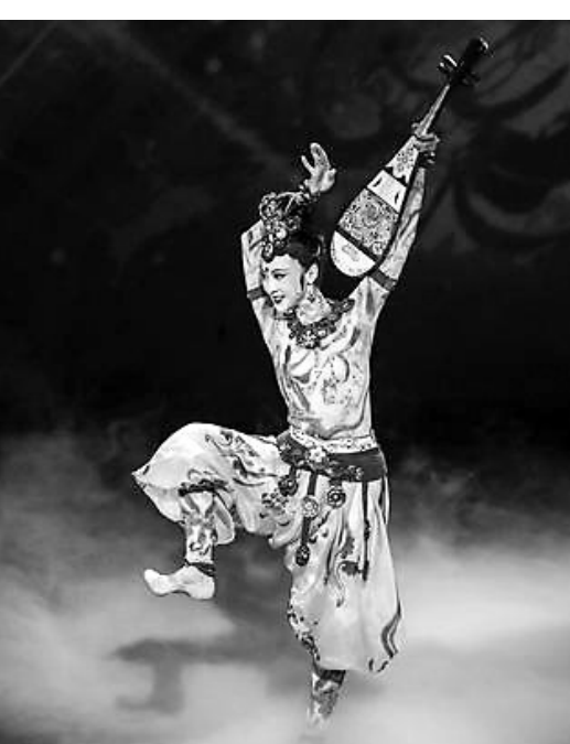
这是9月5日晚在甘肃省敦煌市的敦煌大剧院拍摄的音乐剧《飞天》（音乐会）演出场景。

9月5日晚，音乐剧《飞天》（音乐会）在位于甘肃省敦煌市的敦煌大剧院上演。本场演出精选音乐剧《飞天》中14首经典唱段，以敦煌飞天为灵感，以“一带一路”为主题，荟萃丝路文化元素，讲述敦煌精彩故事。