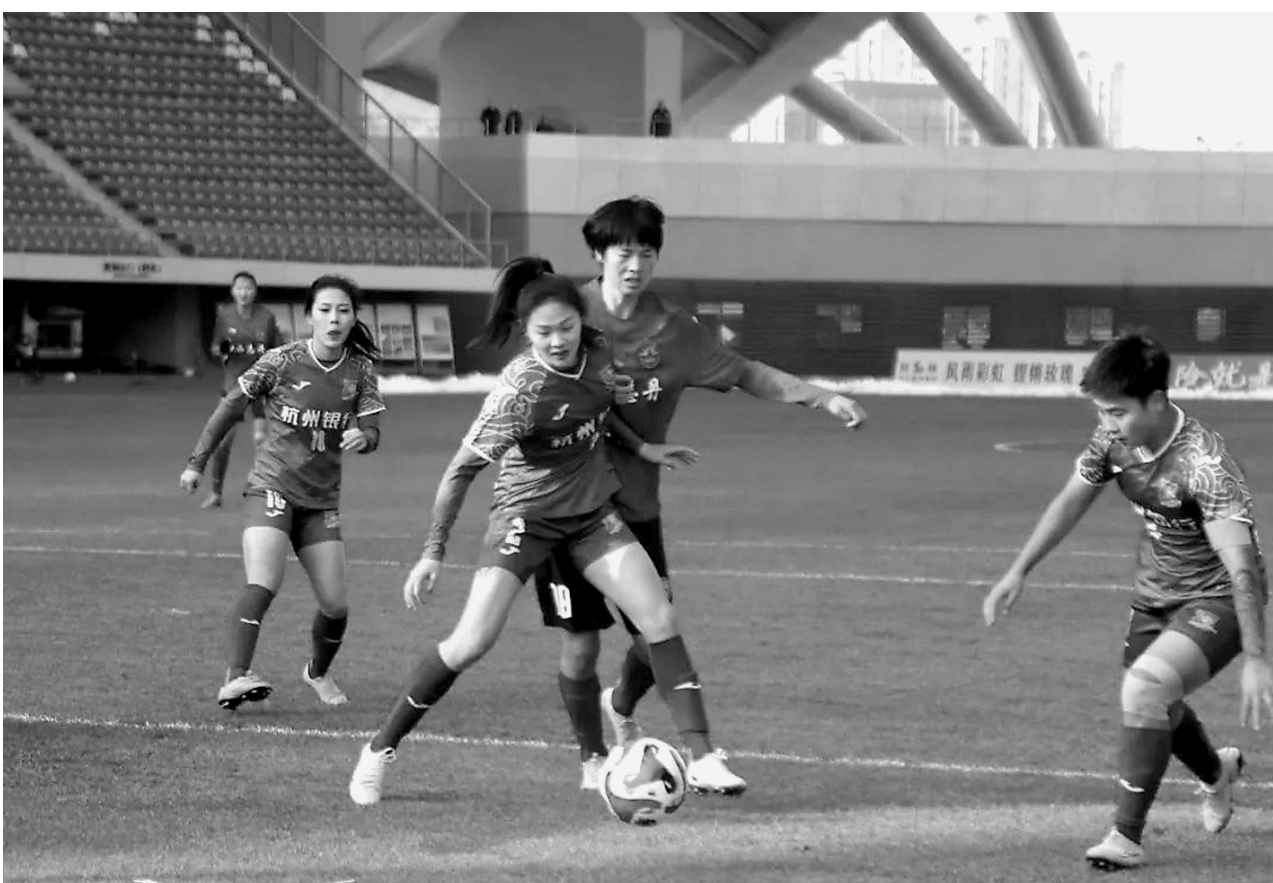
● 11月11日下午，2023中国足球协会女子足球超级联赛第18轮拉开战幕。

今后，延安体育将积极引进“级别高、水平高、参与度高、影响力大”的各类体育赛事，充分发挥延安全民健身运动中心大型体育场馆竞赛表演的承接功能，全力打造集全民健身、体育竞技、文艺演出、旅游观光、休闲娱乐为一体的大型综合性体育文化交流中心，为延安的体育事业发展添砖加瓦。