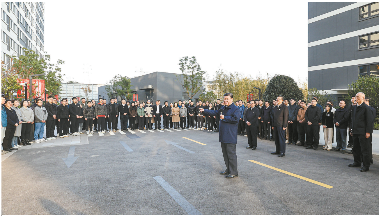
11月28日至12月2日，中共中央总书记、国家主席、中央军委主席习近平在上海考察。这是11月29日下午，习近平在闵行区新时代城市建设者管理者之家，同社区居民亲切交流。

新华社上海/江苏盐城12月3日电 中共中央总书记、国家主席、中央军委主席习近平近日在上海考察时强调，上海要完整、准确、全面贯彻新发展理念，围绕推动高质量发展、构建新发展格局，聚焦建设国际经济中心、金融中心、贸易中心、航运中心、科技创新中心的重要使命，以科技创新为引领，以改革开放为动力，以国家重大战略为牵引，以城市治理现代化为保障，勇于开拓、积极作为，加快建成具有世界影响力的社会主义现代化国际大都市，在推进中国式现代化中充分发挥龙头带动和示范引领作用。 11月28日至12月2日，习近平在中共中央政治局委员、上海市委书记陈吉宁和市长龚正陪同下，先后来到金融机构、科技创新园区、保障性租赁住房项目等进行调研。 28日下午，习近平一列火车就前往上海期货交易所考察。他结合电子屏幕和重要上市品种交割品展示，听取交