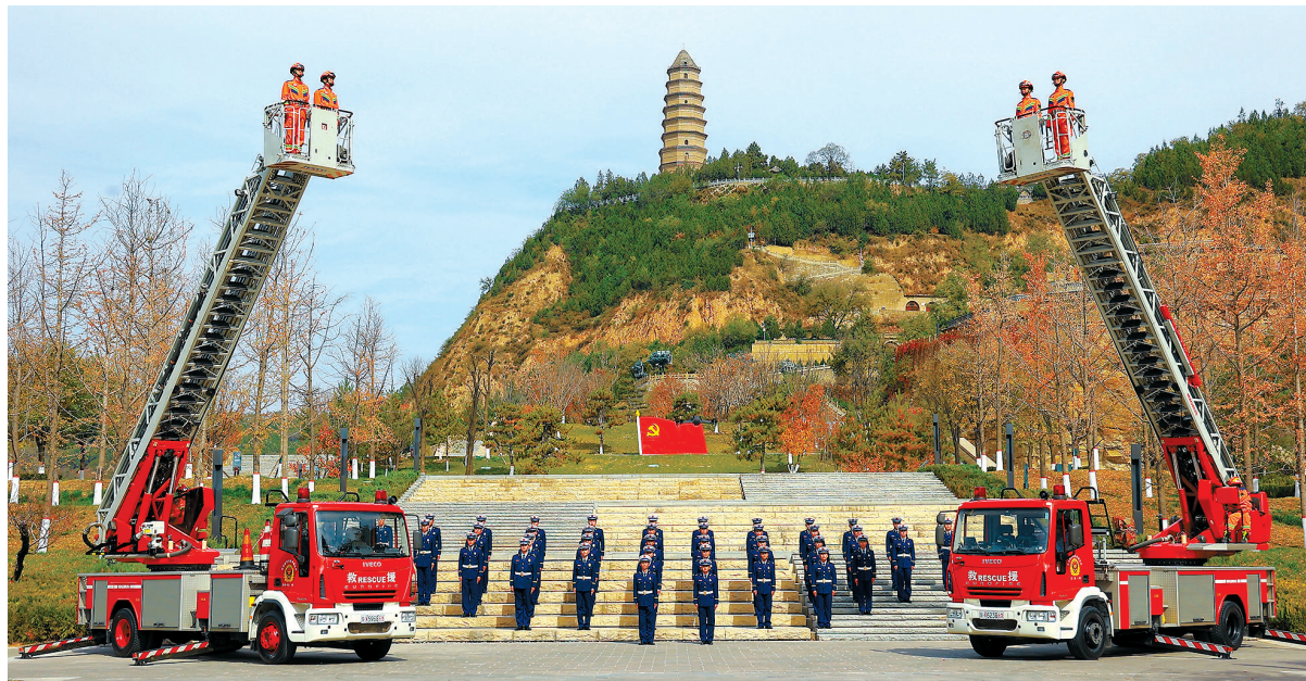
● 宝塔山下的忠诚卫士

在习近平总书记向国家综合性消防救援队伍授旗致训词五周年之际，中央宣传部授予延安市宝塔区宝塔消防救援站“时代楷模”称号，褒扬他们是“宝塔山下的忠诚卫士”。这支诞生于宝塔山下、成长于延河岸边的消防救援队伍，半个世纪以来，聚焦主责主业，苦练技术本领，在急难险重任务中冲锋在前，守护着辖区75万人民群众的生命财产安全和红色革命旧址的安全，被老区人民亲切地誉为“红军传人、人民卫士”。即日起，延安融媒体中心推出系列报道，全方位展示宝塔消防救援站“救民于水火，助民于危难，给人民以力量”的先进事迹，希望大家汲取榜样力量，在全市掀起学习楷模、争当先进的热潮。