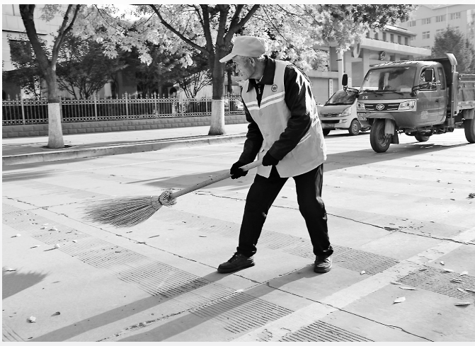
● 环卫工人打扫卫生

在这幅生态宜居画卷的背后，处处体现着安塞区委、区政府立足民生、改善环境的智慧和魄力。近年来，安塞区本着“巩固增强、完善提升”，抓重点、补短板、强基础，建设“四美”乡村，立足实际对全区8个镇、3个街道办及乡主干道两侧展开农村人居环境综合整治攻坚战。安塞区人民用行动践行着“不等不靠，美丽家园自己建设，幸福生活自己创造”的梦想。