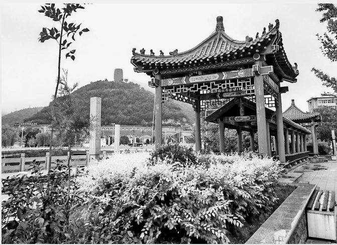
● 公园一角(资料图片)