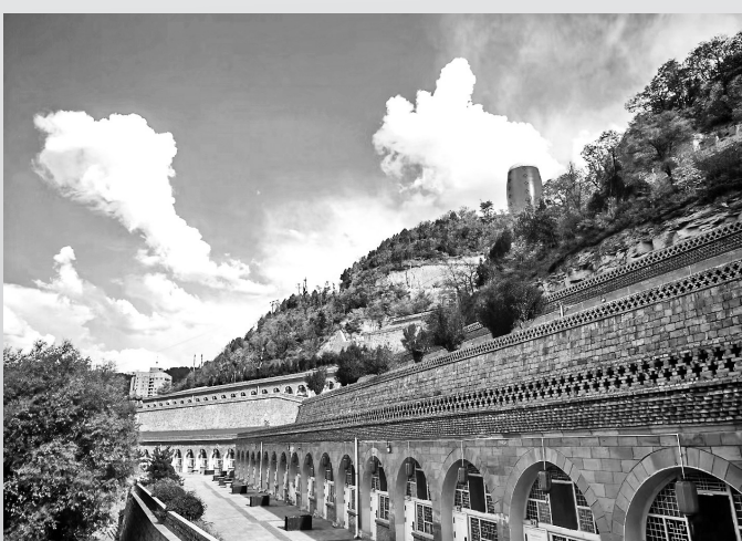
● 腰鼓山是居民避暑的好去处(资料图片)