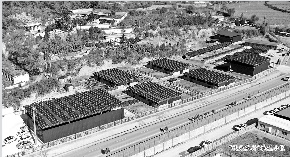
“牧光互补”养殖小区

近日,走进吴起县五谷城镇“牧光互补”光伏发电项目现场,一块块整齐排列在牛棚和梅花鹿棚顶上的光伏板,在冬日暖阳的照耀下正源源不断地输送着“绿电”,而棚下一头头体格健硕、毛色油亮的安格斯黑牛和梅花鹿正享受着槽里的草。