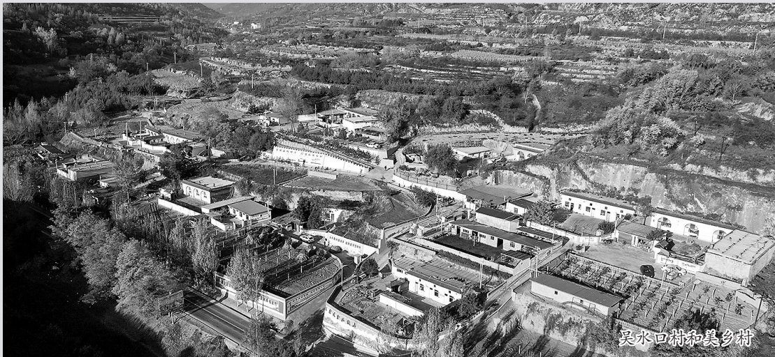
吴水口村和美乡村

乡村振兴,向美而行。今年以来,吴起县坚持把建设宜居宜业和美乡村作为全面实施乡村振兴战略的重要任务,不断改善农村人居环境面貌,培育特色优势产业,创新乡村治理新模式,加快推进农业农村现代化进程,促进农村增“颜值”、提“气质”、升“品质”,切实提高群众获得感、幸福感,以绣花功夫绘就乡村振兴新画卷。