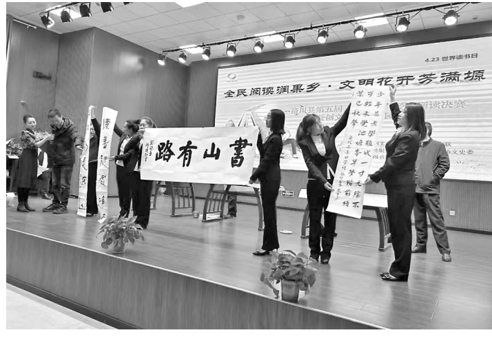
● 开展“经典诵读”“全民阅读”等创文宣传“六进”活动