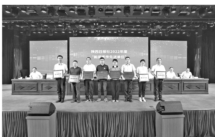
● 县委宣传部荣获陕西日报社“新闻宣传先进单位”

按照干部作风能力提升年活动总要求,持续巩固效能提升工作成效,各单位与干部签订“三个年”活动暨“立足岗位作贡献”活动追赶超越目标任务书,通过年初承诺、年底兑现的形式量化工作成效;以主题教育为抓手,持续推进理论宣讲、新闻采编、网络评论三支专业队伍建设,先后进行宣讲培训、轮岗轮训、跨域交流6次,切实提高了干部工作能力和效率;组织全体干部集中学习交流15次,参加主题教育暨意识形态工作应知应会知识测试2次,不断推动学习往深里走、往实里走、往心里走;宣传思想文化系统深入开展“四个一”活动,即每月一次理论宣讲、一次理论研讨、一次调查研究,每季度一次工作调度,努力打造一支政治过硬、本领高强、求实创新、能打胜仗的宣传思想文化工作队伍。