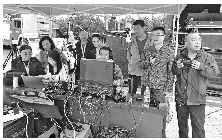
● 大型直播活动现场