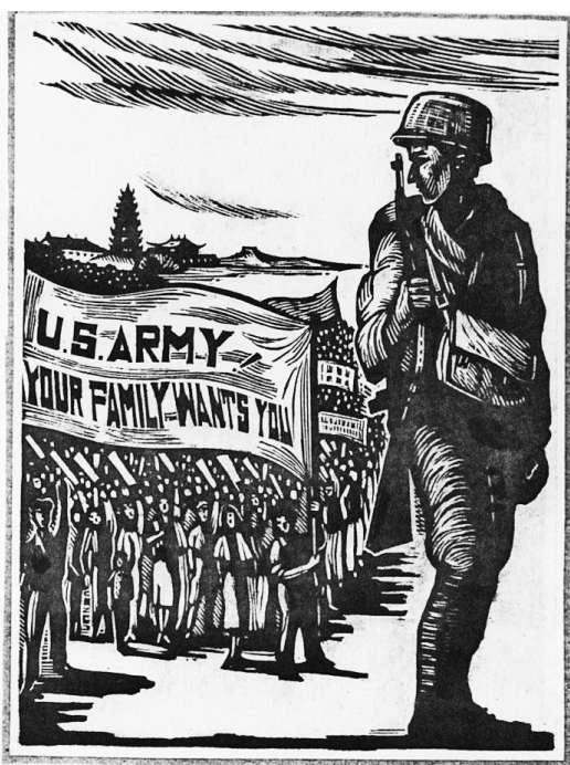
1946年10月,为响应“美军退出中国周”,董荡平作了版画《美军回家去》

1946年10月7日,延安各界名流60多人,由谢觉哉、续范亭、李鼎铭、李敷仁等8人领衔集会,一致