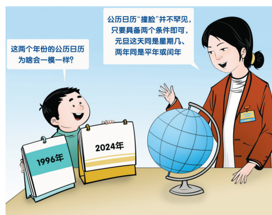
并不罕见 新华社发 曹一 作

新华社天津1月17日电(记者 周润健)近日,一则“2024年与1996年的公历日历完全一样”的消息引发公众关注。这两个年份的公历日历为啥会一模一样?听听天文科普专家怎么说。