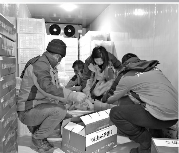
● 工作人员在装箱发货