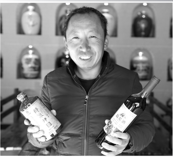
● 农民化身主播推介农产品