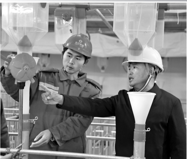
● 工人在项目施工现场交流