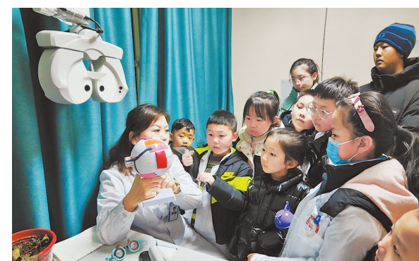
● 学生认真听医生讲解