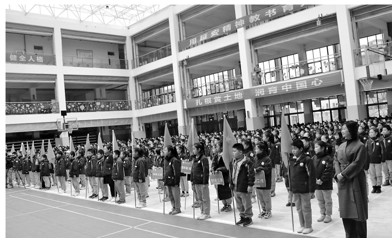
● 延安新区第二小学开展学雷锋主题教育活动