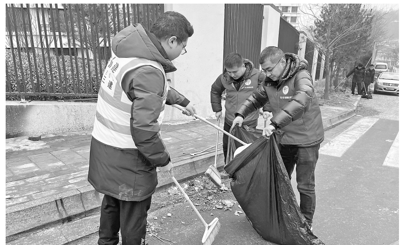
● 志愿者在社区清扫垃圾