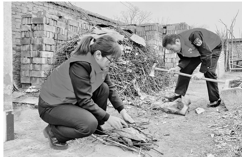
● 交控集团志愿者入户为群众干活

据了解,自2023年起,宝塔山社区每隔一周都会组织理发师进社区,为老人们免费理发,获得了群众的广泛好评。