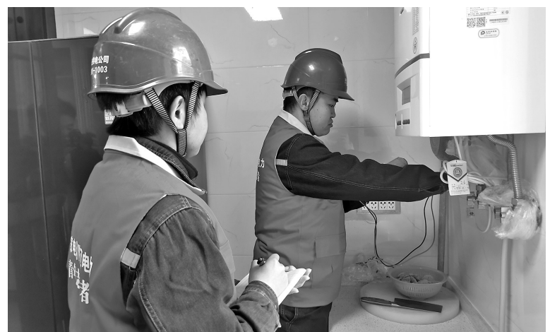
● 电力青年服务队队员入户检修