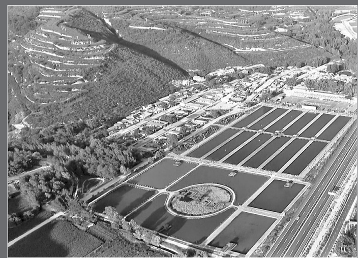
● “四好农村路”贯穿渔业休闲小镇

据了解，黄龙县公路总里程共计1100.2公里，其中高速公路、国道5条262.9公里，省道1条42公里，县道4条117.8公里，乡道6条195.2公里，村道63条482.3公里，形成了以高速公路、国省干线为骨架，农村公路为脉络，干支相连、村村相通的交通网络格局，有效联通了全县47个行政村及周边县区，使黄龙迅速融入了西安、延安两小时交通圈，为全县招商引资、乡村振兴、生态旅游发展及县域经济发展提供了有力的交通保障。