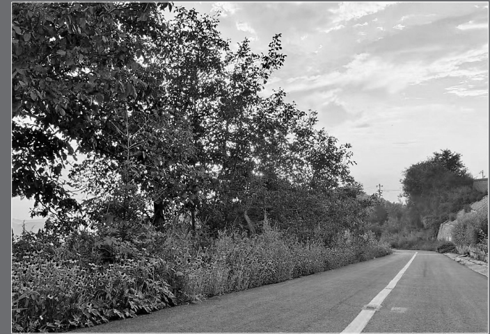
● 界头庙镇“四好农村路”

一条条贯穿城乡的发展路、一条条串村连景的畅通路、一条条赋能乡村发展的振兴路，在黄龙大地上，描绘出了一幅路畅、村美、民富的美丽画卷。