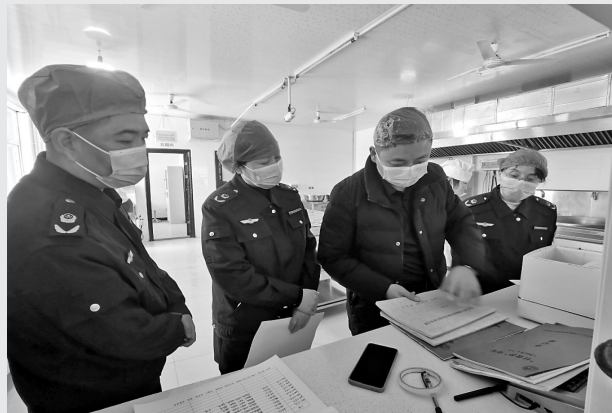
我市开展校园食品安全交叉检查

为有效防范化解校园食品安全风险隐患，保障全市师生饮食安全，自2月29日起至3月11日，市市场监管局组织13个县(市、区)开展了校园食品安全排查整治专项行动跨县区交叉检查。