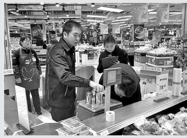
市质院开展计量检定服务

在第42个“国际消费者权益日”来临之际，为维护广大消费者权益，营造良好的消费环境，市质院组织民生计量检定人员，对宝塔区在用的电子计价秤与燃油加油机进行相应的检定工作，确保计量器具的稳定性与准确性。