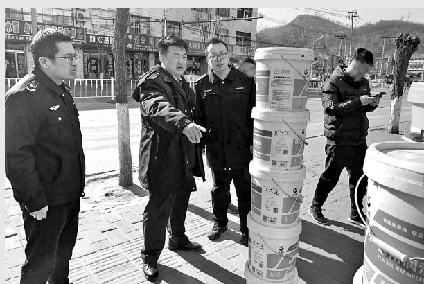
联合开展专项整治

为进一步提升全市市场监管综合执法队伍整体素质，提高执法人员规范执法、精准执法和文明执法的能力，3月份以来，市市场监管局综合执法支队先后深入安塞区、志丹县、子长市等县(市)区，开展工业产品联合执法检查行动。通过现场培训、以查代训、协查联办等方式，助力县区执法队伍提升办案水平。行动开展以来，共发现涉嫌违法案件线索20起，查扣侵权假冒产品570余件，相关案件正在查办中。