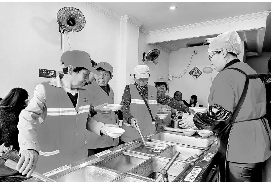
安塞环卫工人正在早餐店有序取餐

本报讯(记者 白雪 通讯员 刘阳)“我们上班早,吃完饭再去干活时间来不及,以前常随便对付一口,现在政府给我们提供免费的爱心早餐,干完活吃上顿热饭,心里暖乎乎的。”