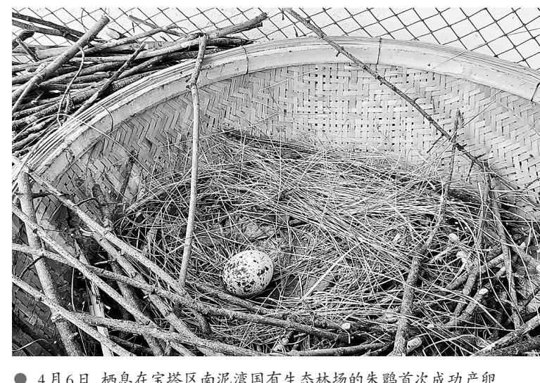
4月6日,栖息在宝塔区南泥湾国有生态林场的朱鹮首次成功产卵

20只朱鹮,开展人工繁育和放飞试验,是探索朱鹮在高原地区的适应能力、恢复朱鹮的迁徙习性、实现朱鹮重现历史分布地的一次重要尝试。